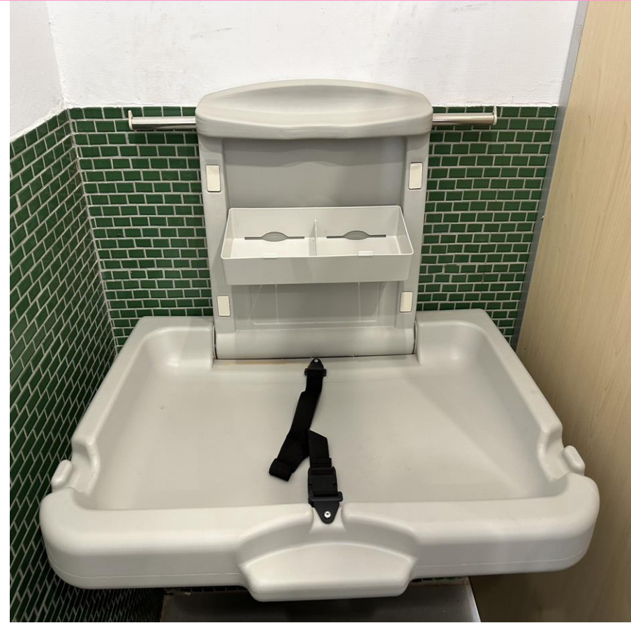
拉門加寬、設置扶手 等友善設施