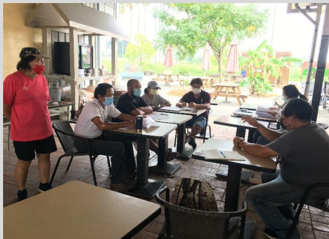
地創共識會議 女性小農共同參與