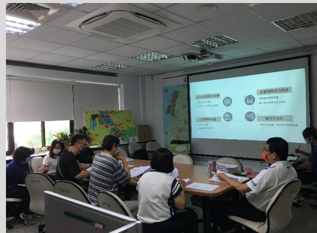
地創評審會議 鼓勵女性提案

CEDAW 第7條 採取一切適當措施，消除在政治和公共生活中對婦女的歧視，以保證她們在男女平等的基礎上享有相同權利